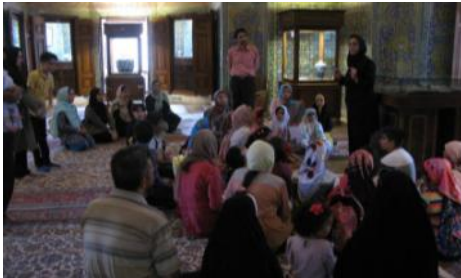
گرامیداشت روز ملی اردبیل