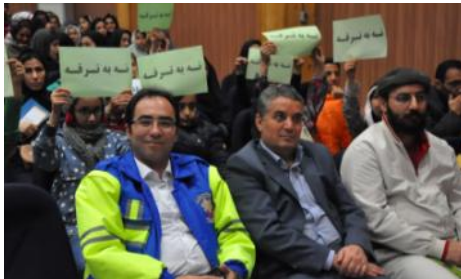
همایش نه به ترقه