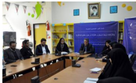
دوره آموزشی آشنایی با حقوق کودکان