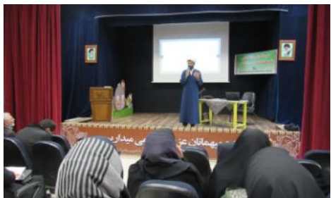
دوره آموزش و توانمندسازی شیوه های انس با نماز