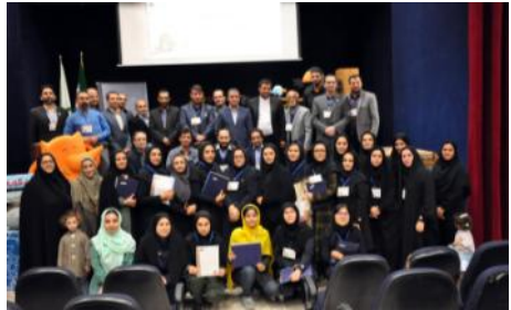
جشنواره قصه گویی مرحله استانی