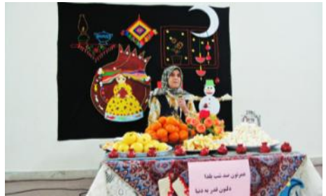
مراسم شب یلدا