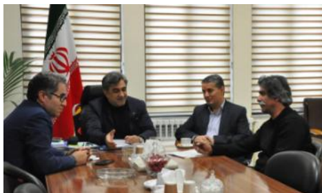
دیدار با مدیران کل استانداری