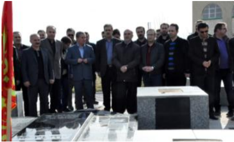
بزرگداشت روز شهدا