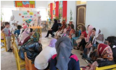
گرامیداشت دهه کرامت