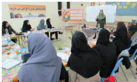
دوره آموزش کارگاه شعر