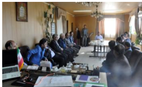
نشست با مدیر کل محترم هواشناسی