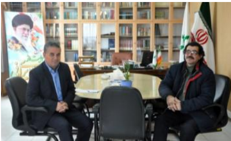
حضور هنرمندان و اعلام همکاری با فعالیتهای کانون