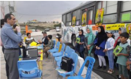
طرح پویش فصل گرم کتاب