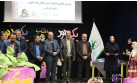
میزبانی از جشنواره قصه گویی منطقه ۱ کشوری