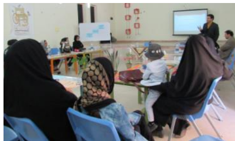
کارگاه آموزشی کودک و رسانه