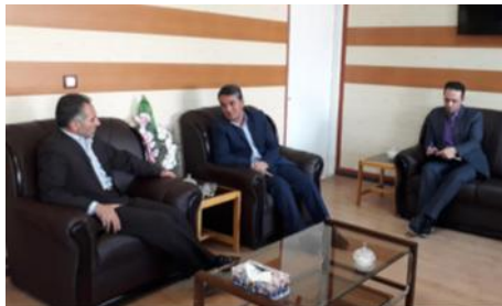
دیدار با فرماندار محترم خلخال