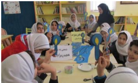
گرامیداشت روز مادر و مقام زن