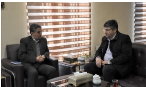
دیدار با مدیر کل میراث فرهنگی، صنایع دستی و گردشگری