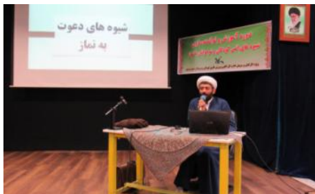
دوره آموزش و توانمندسازی شیوه های انس با نماز