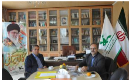
دیدار با مدیرکل هواشناسی