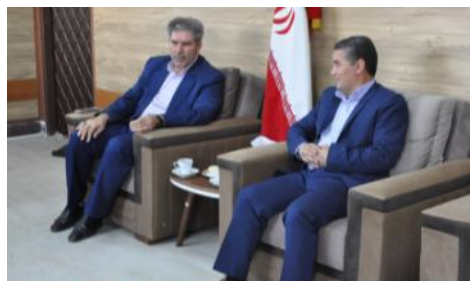
دیدار با فرماندار محترم نیر