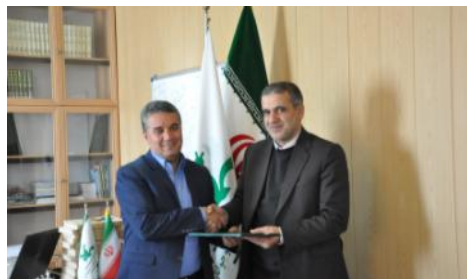
نشست با مدیر کل محترم حفاظت محیط زیست