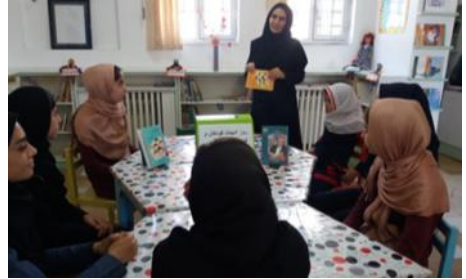
گرامیداشت روز ادبیات کودک و نوجوان