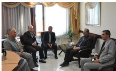
دیدار با مدیران کل استانداری