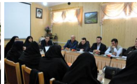
نشست با مدیر کل محترم هواشناسی