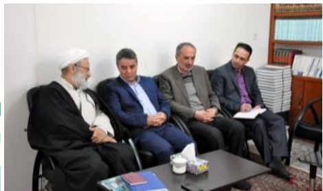
دیدار با امام جمعه محترم خلخال