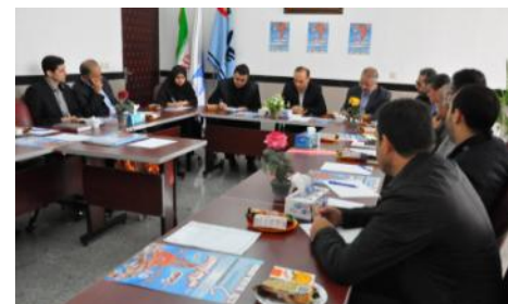
نشست با مدیر کل محترم محیط زیست