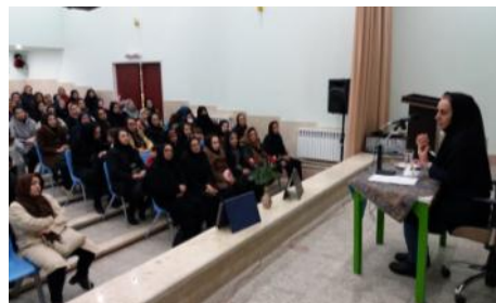
کارگاه آموزشی مهارت های زندگی برای اولیا