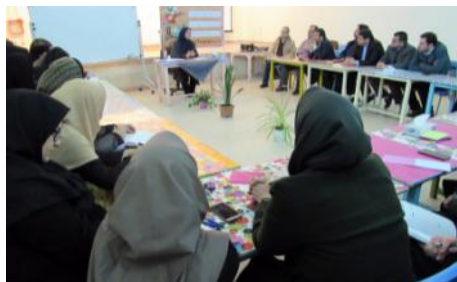
دوره آموزش ثبت و مستند سازی فعالیت های فرهنگی