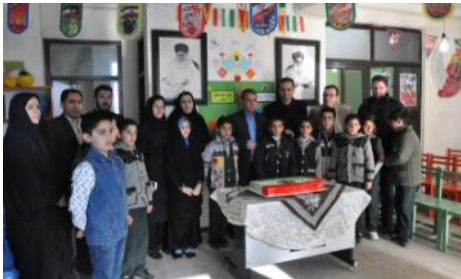
گرامیداشت دهه مبارک فجر