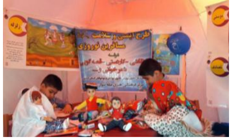
طرح عیدانه کتاب