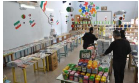
برگزاری نمایشگاه عرضه کتاب و محصولات