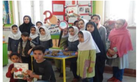
گرامیداشت هفته پژوهش