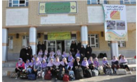
اردوی استانی اعضای فعال دختر مراکز استان