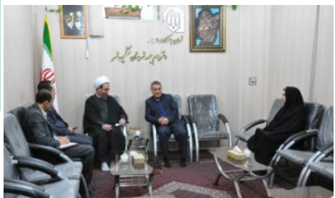
دیدار با امام جمعه محترم مشکین شهر