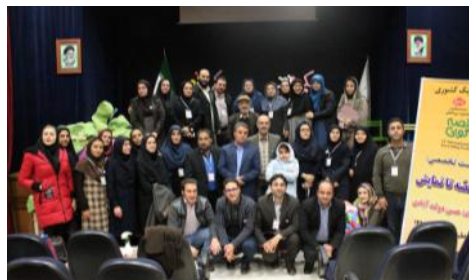
برگزاری کارگاه آموزشی از قصه تا نمایش