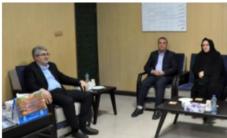
دیدار با فرماندار محترم گرمی