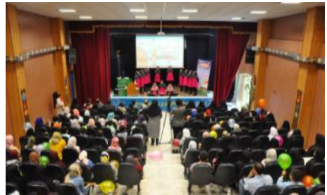
گرامیداشت دهه کرامت