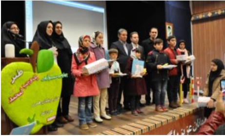
برگزاری جشنواره طنز یک وجب لبخند