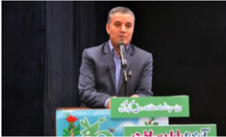
گرامیداشت هفته ملی کودک