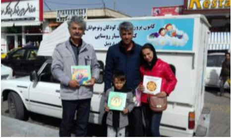
طرح عیدانه کتاب