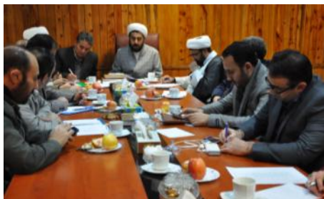
نشست با مدیر کل محترم سازمان تبلیغات اسلامی