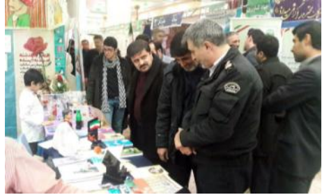
حضور در نمایشگاه دستاوردهای ۴۰ سالگی انقلاب