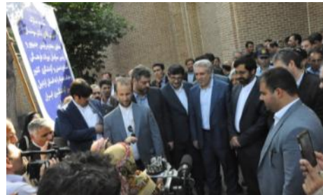
استقبال اعضای کانون از معاون محترم رئیس