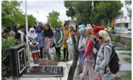
غبارروبی مزار شهدا